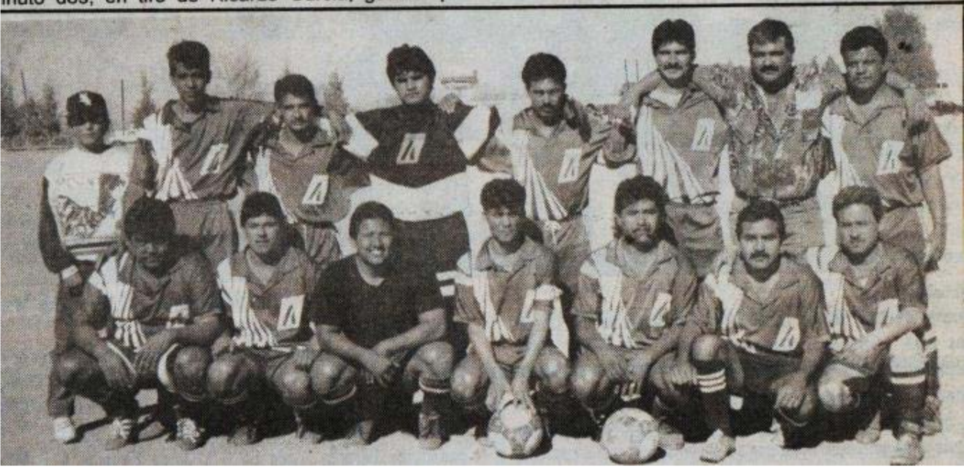
Industrias Apson, muy buen equipo, ganó en el campo y perdió en la mesa el campeonato.