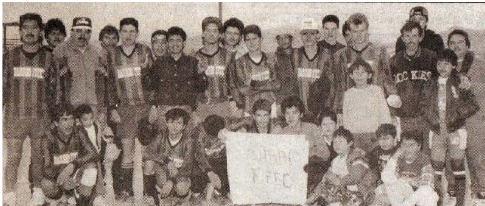
El equipo subcampeón, Barrio del Ferrocarril.