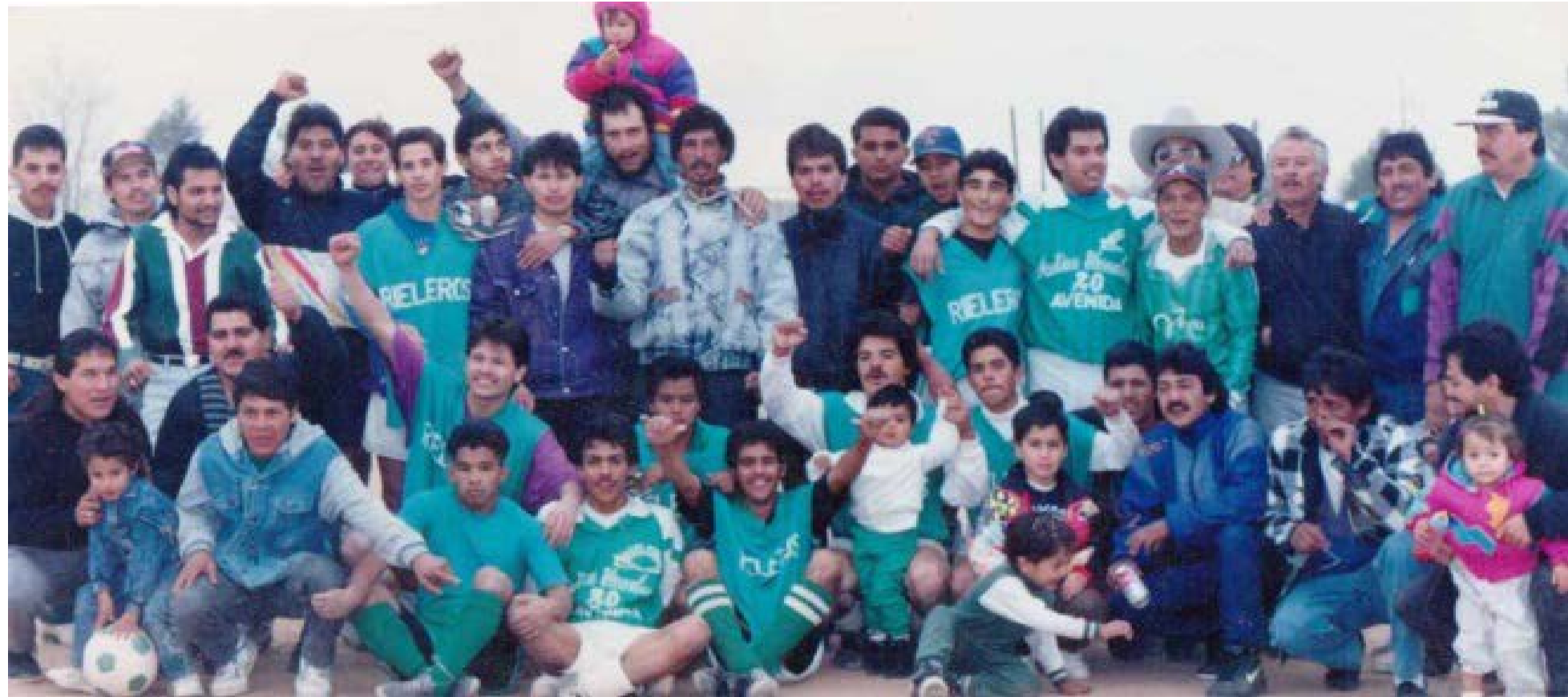
Rieleros "B" fue el Campeón de la Liga Municipal de Segunda Fuerza, Temporada de Verano 1993