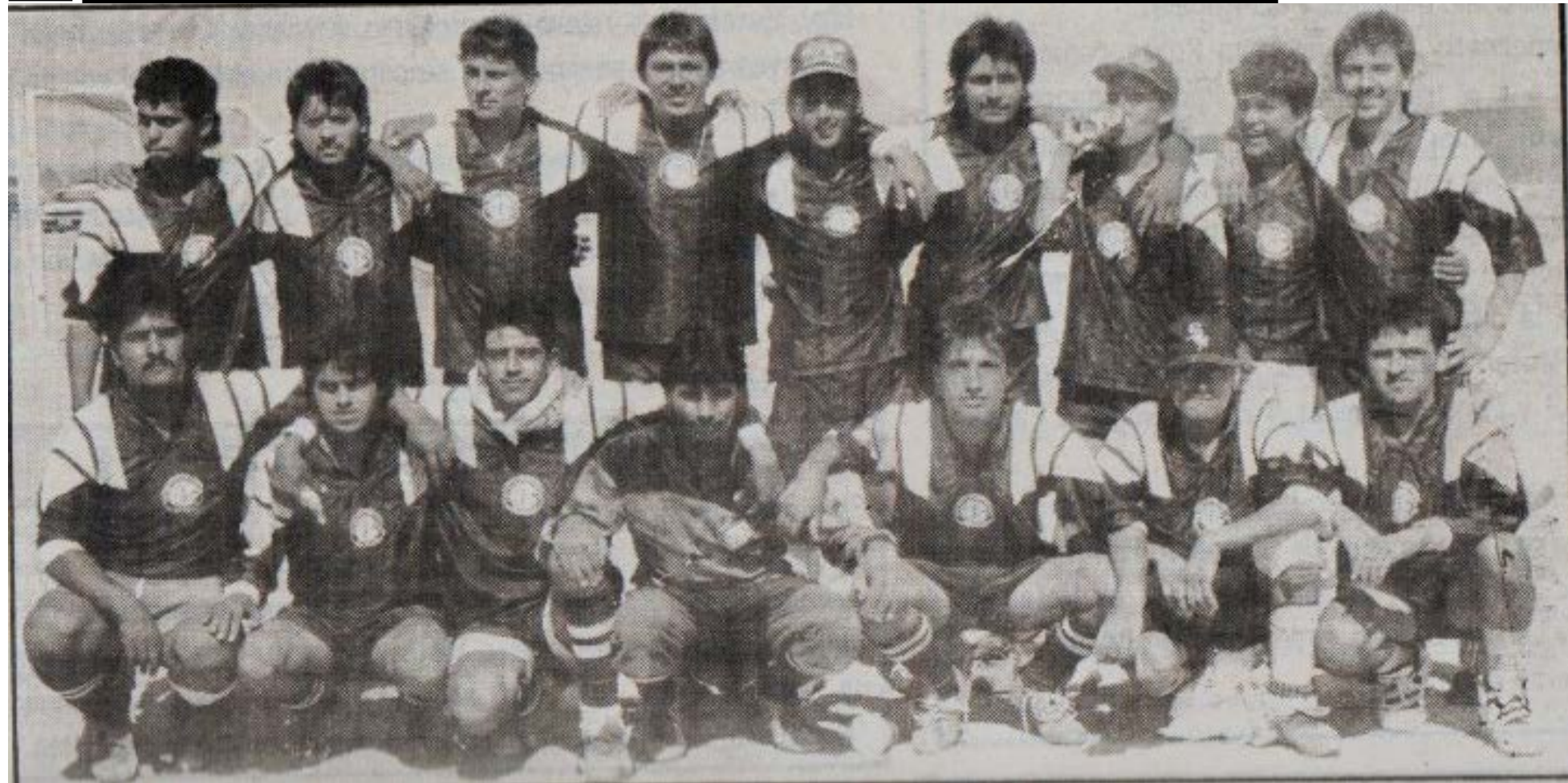
Equipo Atlético Industrial "B" finalizó invicto en la primera vuelta en la Temporada 1994.