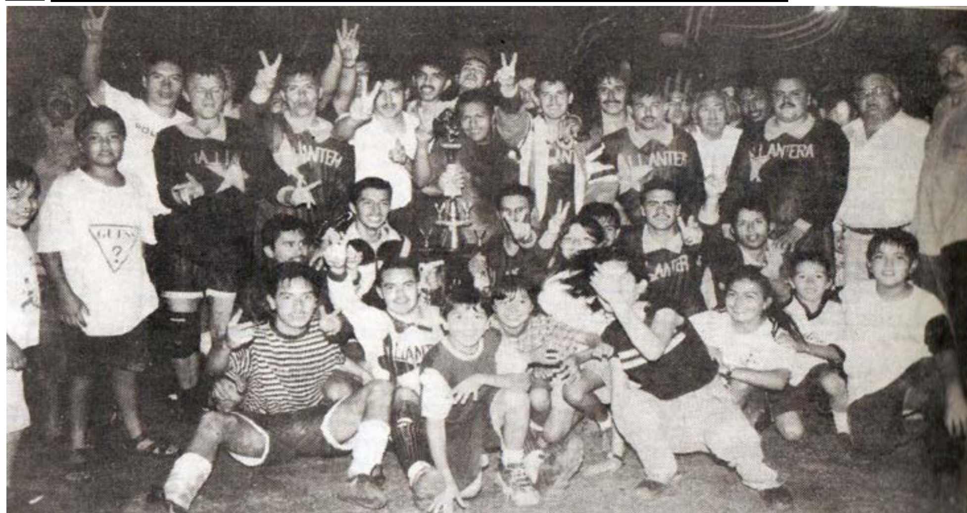
Llantera Industrial fue el campeón de la Primera A, en 1997 al derrotar a El Clarín en tiros penales.