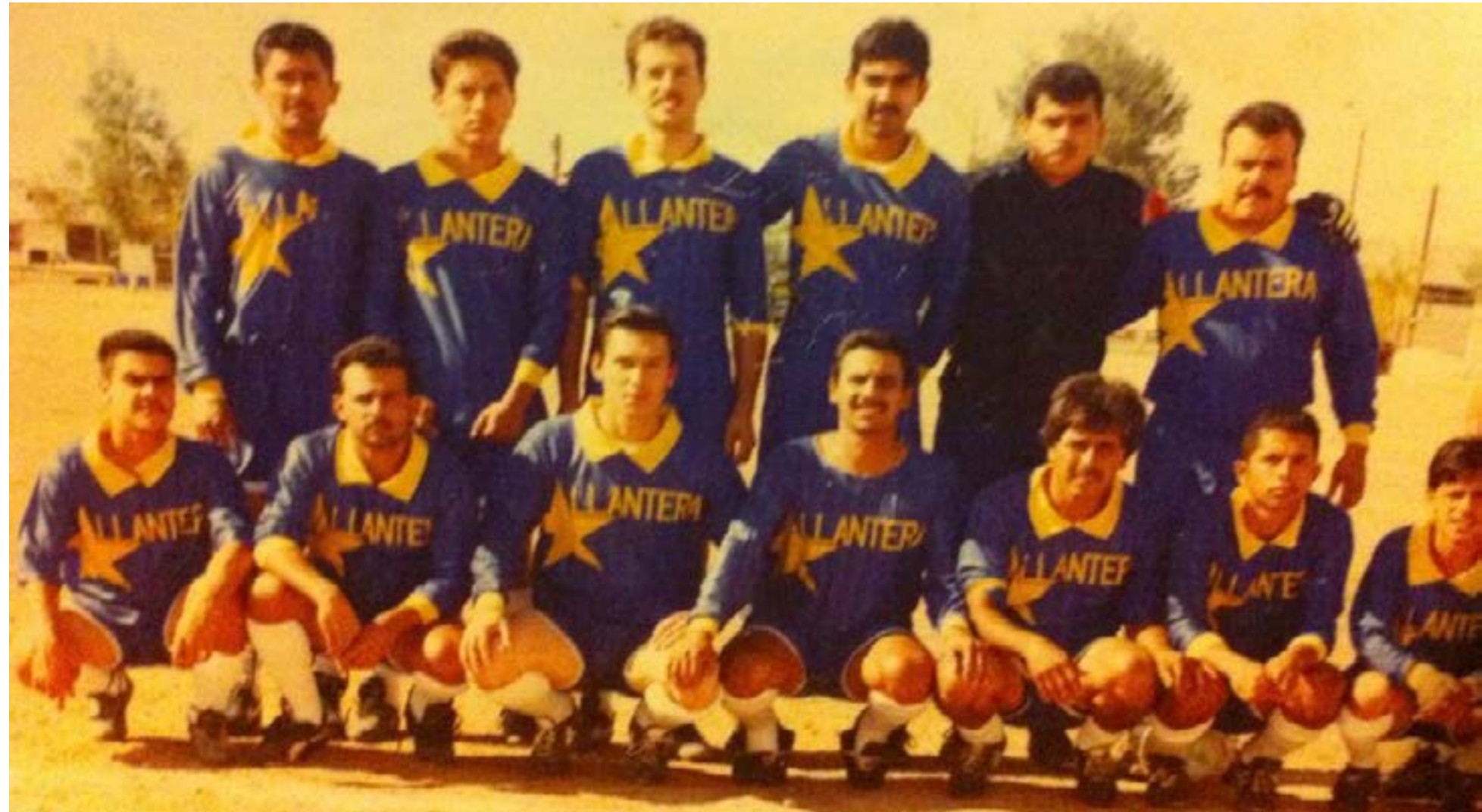
Llantera Industrial ganó la Copa Campeón de Campeones en la inauguración de la Temporada 1997-1998 de la Liga Municipal de Fútbol de Primera Fuerza al derrotar a Vibro Block, 2 goles a 1.