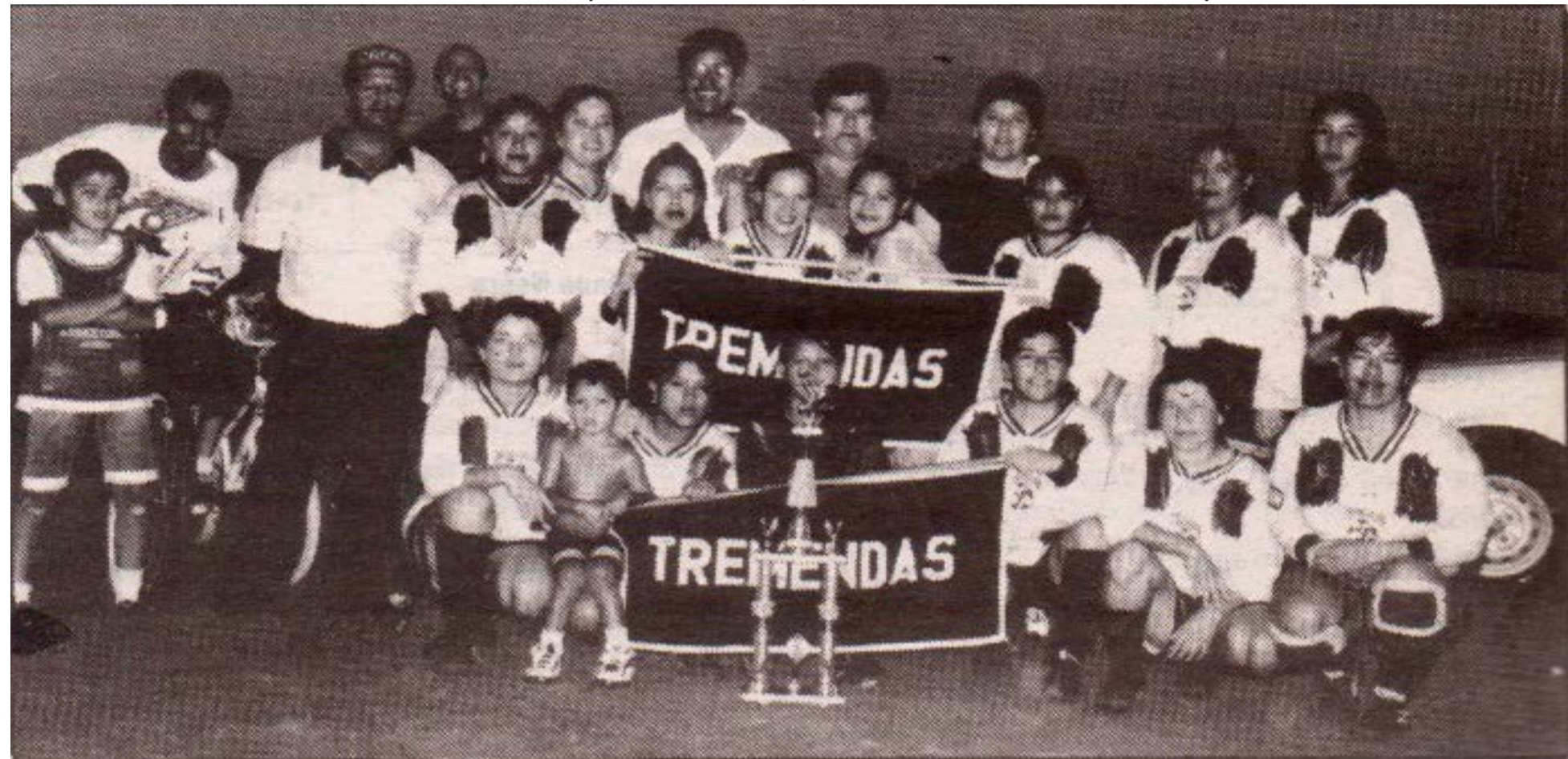
Tremendas ganó el campeonato de Liga Intermaquiladora de Futbol Femenil CROM, Temporada 1997, al derrotar al equipo Ladrillera.