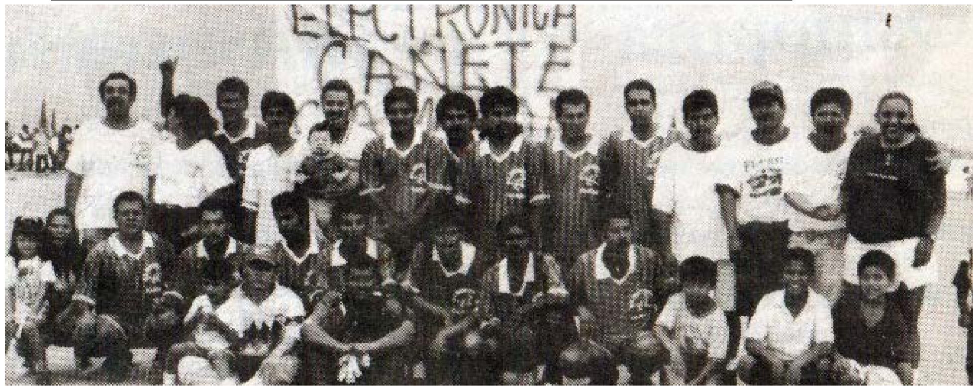
Electrónica Cañete ganó el campeonato de Liga Intermaquiladora de Fútbol CROM, en el año 1997.