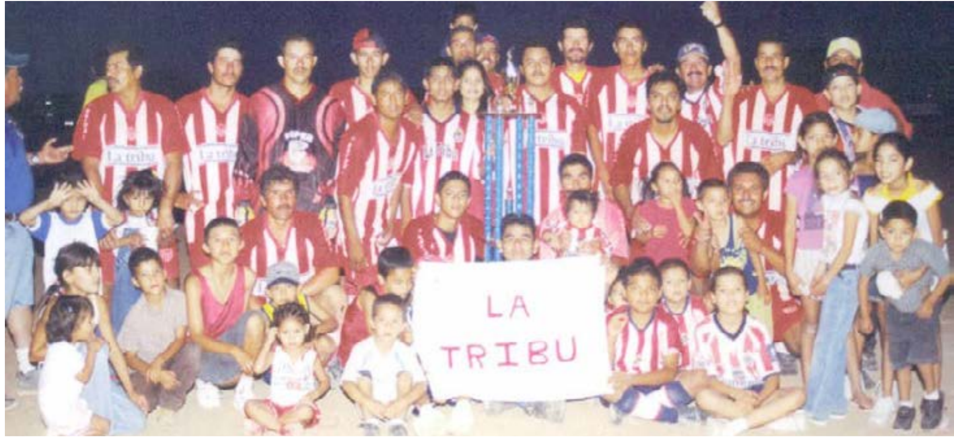
El equipo La Tribu se coronó campeón de la categoría Primera "B", de la Liga de Fútbol CROM, en la Temporada del año 2004.