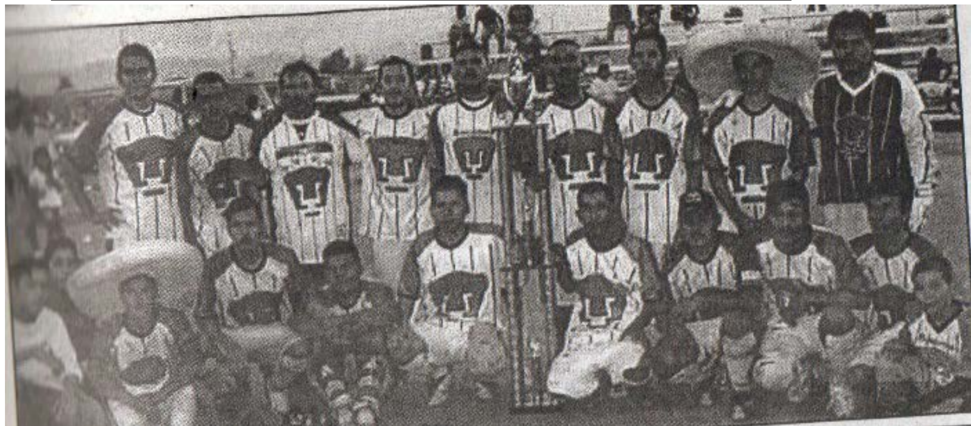
El equipo Pumas ganó el campeonato de la categoría Primera "A", de la Liga de Fútbol CROM, en la Temporada del año 2004.