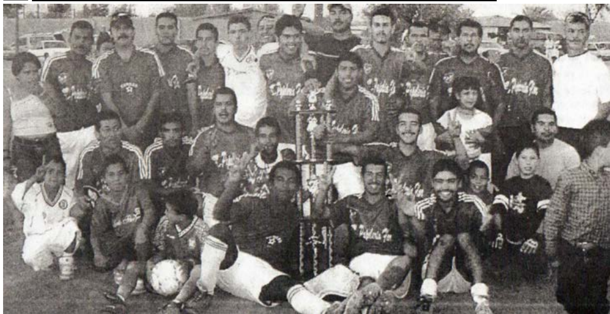
El equipo Papelería Flor ganó el campeonato de la categoría Primera "A", de la Liga de Fútbol CTM en la Temporada del año 2004.