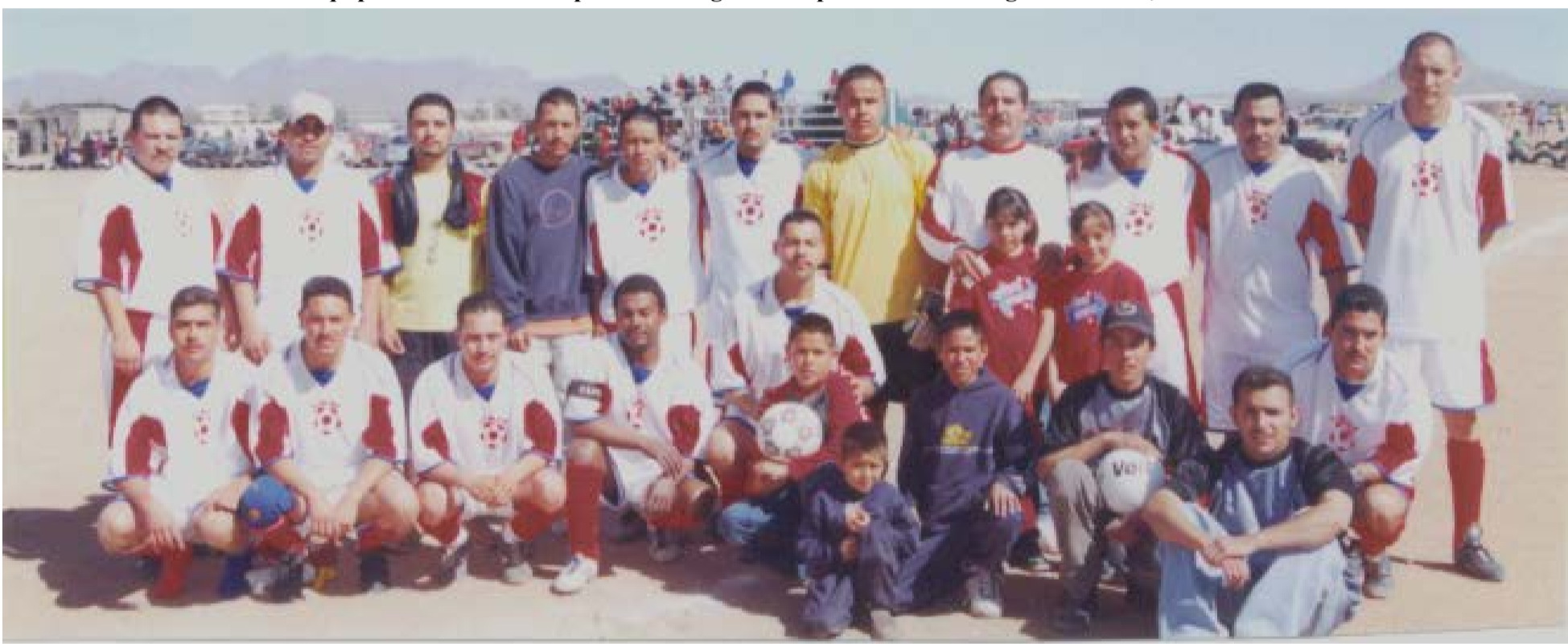
Exterminador ganó la Copa Campeón de Campeones de la Liga de Futbol CROM, el año 2004.