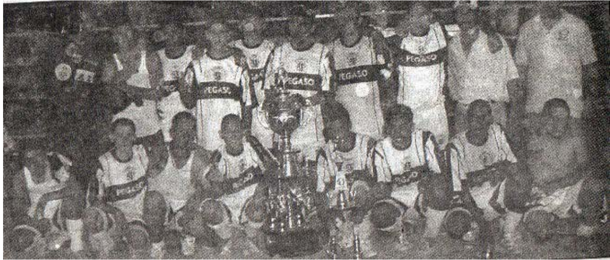
El equipo Atlético Juvenil se coronó campeón de la Liga Municipal de Fútbol en la categoría Libre, en la Temporada del año 2004.