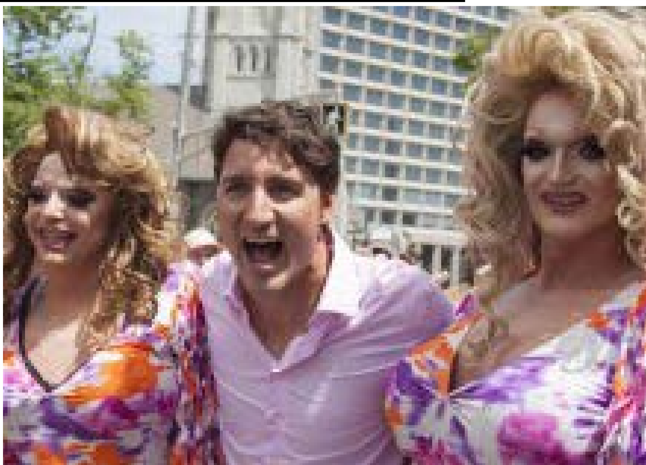
El primer ministro de Canadá, Justin Trudeau reformó la Ley para prohibir criticar la transexualidad.

Poco después fue cuando se decidió cambiar la bandera de Canadá por la actual de la hojita de maple. Ahora en el siglo XXI, su hijo se convirtió en primer ministro, Justin Trudeau, posiblemente la persona menos calificada en todo el planeta para manejar un país. Un profesor suplente de teatro que logró encantar a todos con su propia