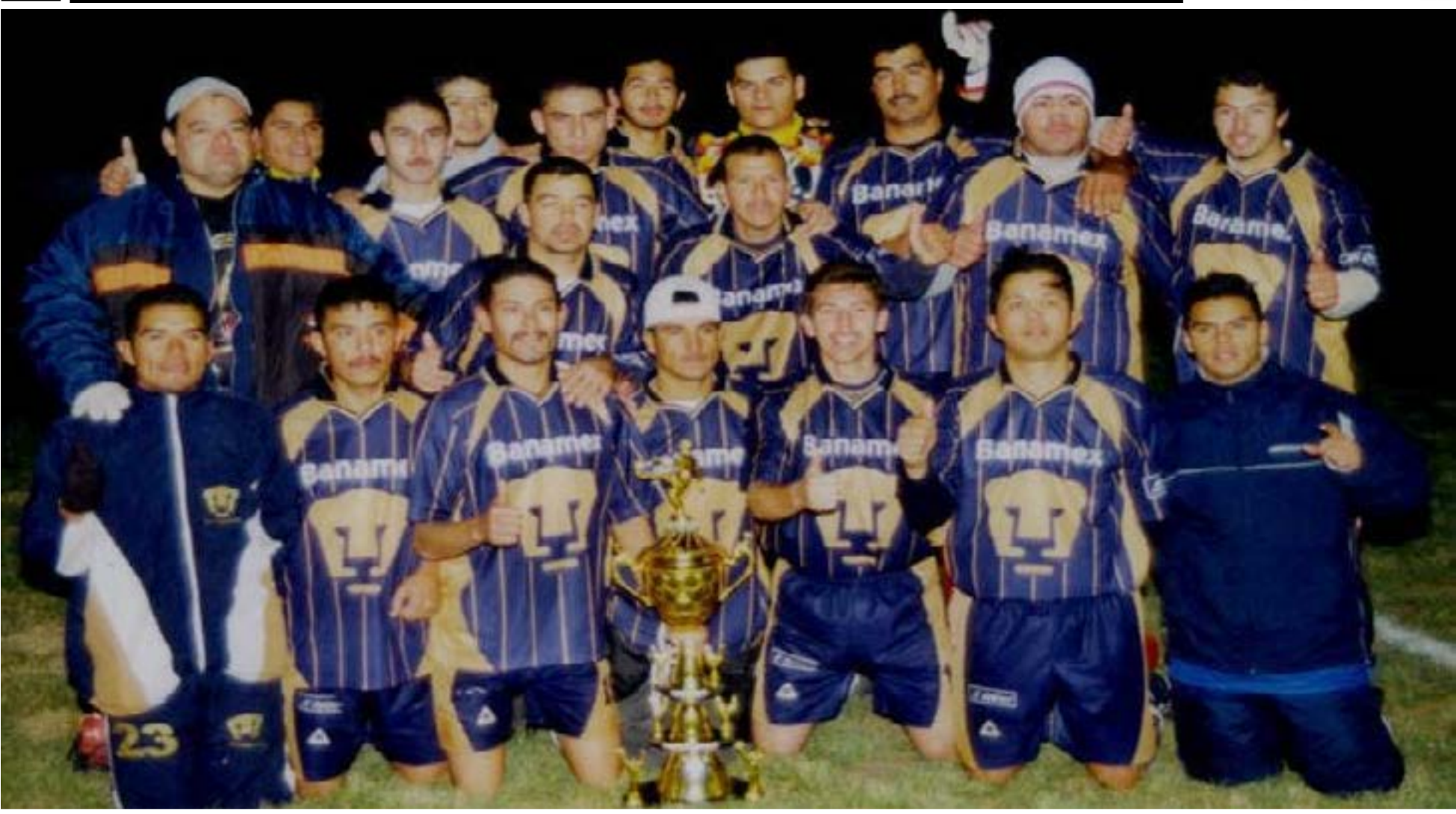
El equipo Pumas fue el campeón de la Liga Municipal de Futbol categoría Premier, el año 2004.