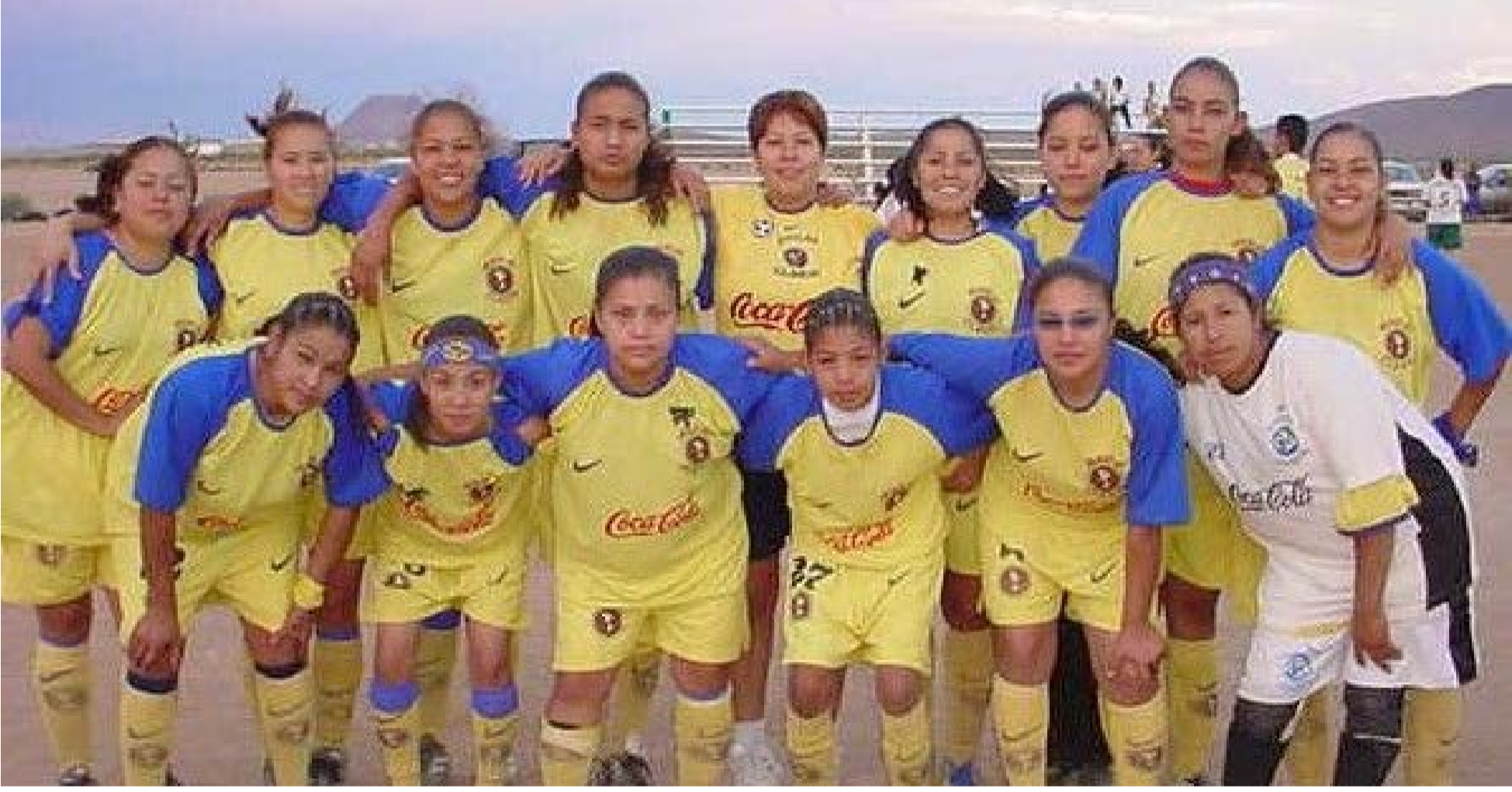
El equipo El Clarín ganó el cuarto campeonato en forma consecutiva, de la Liga Femenil de Fútbol CROM, el mes de junio de 2004 para convertirse en Tetracampeonas.