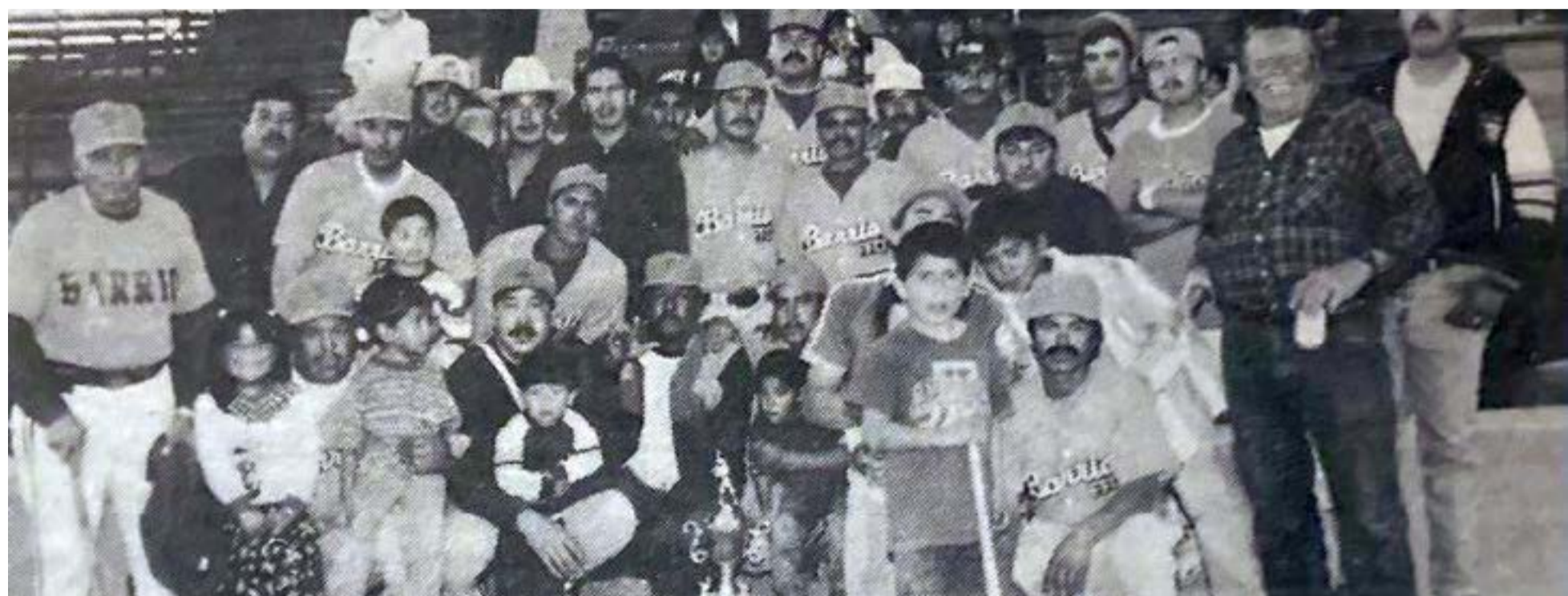
El equipo Barrio se tuvo que conformar con el subcampeonato de la Liga Invernal de Béisbol, en 1998.