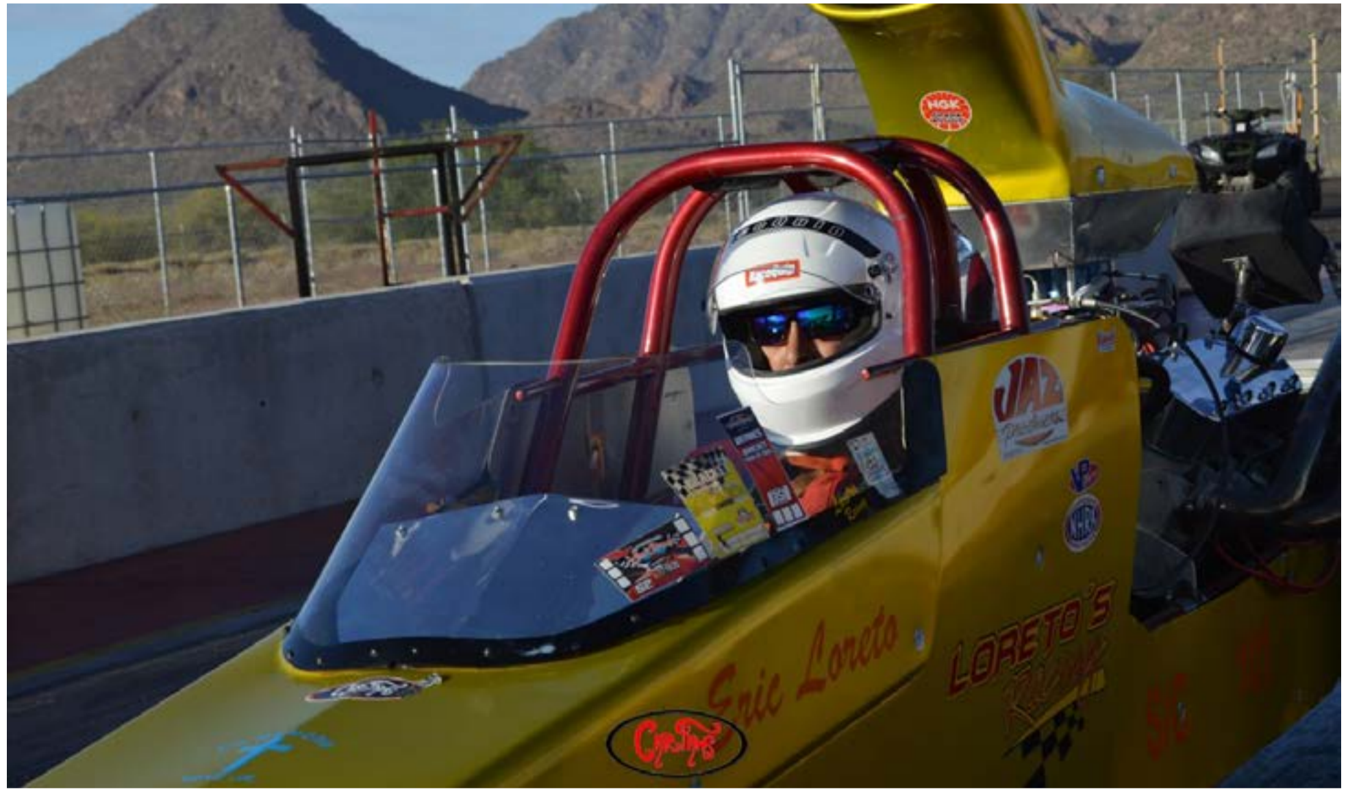
Muchas felicidades 🎉!! a LORETOS RACING TEAM , en su bonito DRAGSTER por el tiempo más bajo registrado hasta el momento en Autódromo Sosa's de Agua Prieta, Sonora, con un tiempo de 5:88 en el 1/8 de milla 🏁 !! 🏆

Primeros y segundos lugares de cada categoría 🏆 🌟