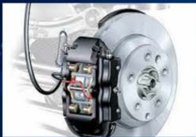
Sistema de Frenos ABS