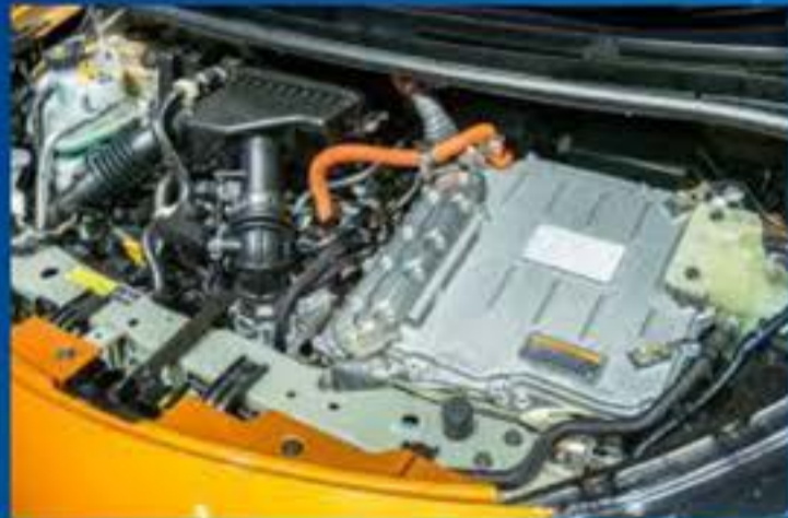
Sistema electrónico automotriz en general

Calle 6 y Libertad avenida Azueta. Cel: 633-409-1327