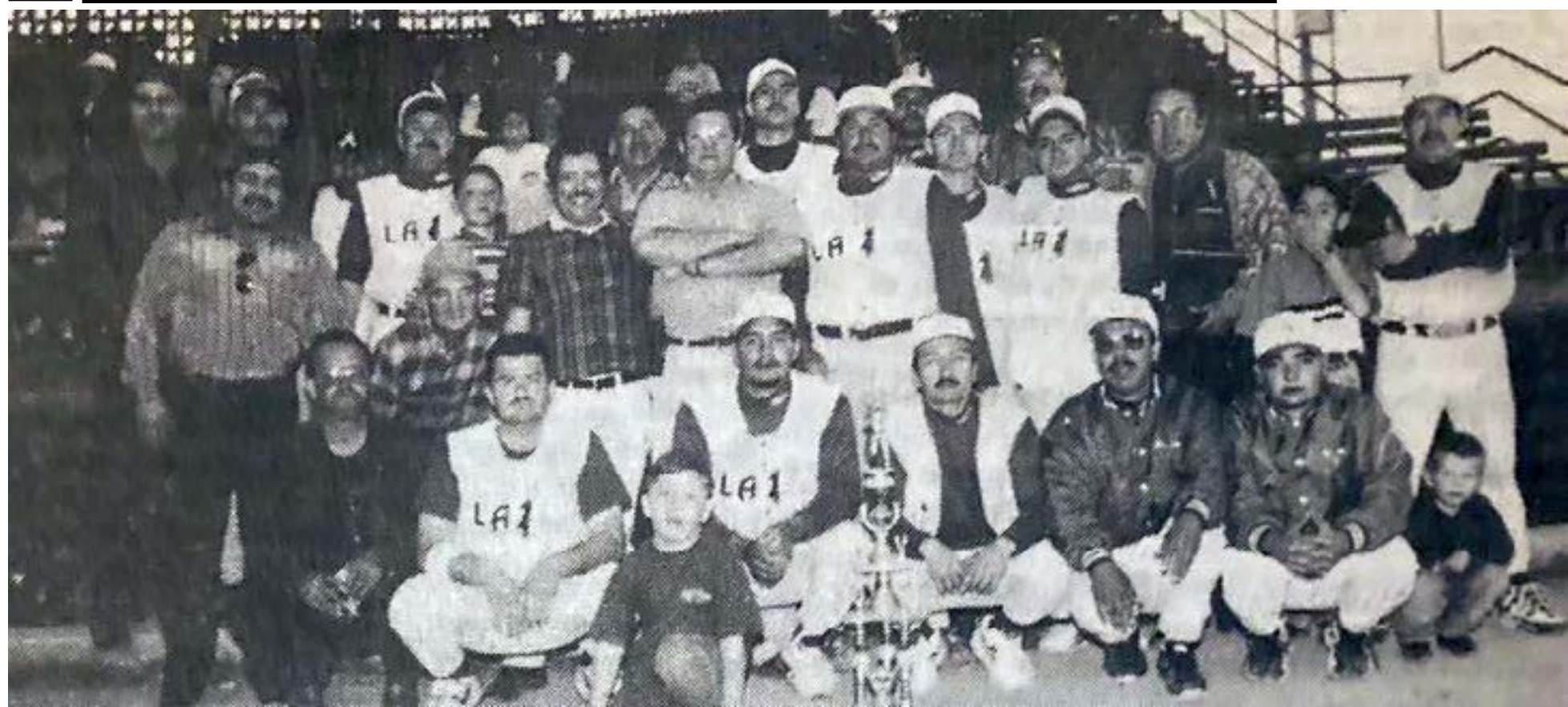
Láser ganó el campeonato de la Liga Invernal de Beisbol, Temporada 1997-1998, convirtiéndose en Bicampeones.