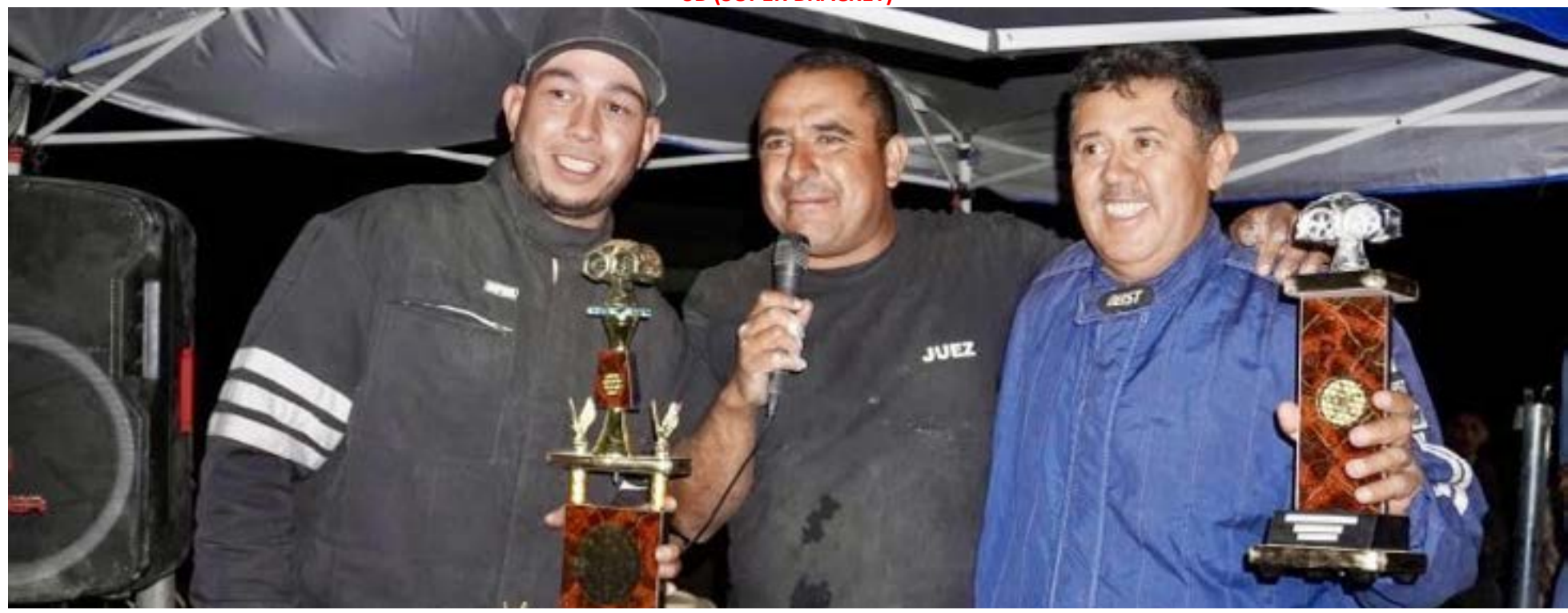
Premiación al "Pacheco" y al "Pachocha"