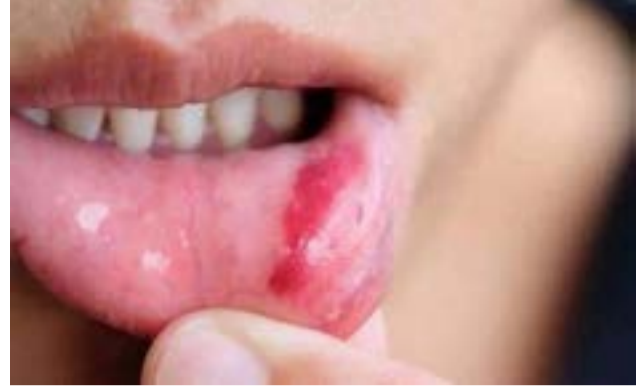
El cáncer de boca se presenta al momento en el que las células de los labios o la boca, desarrollan

cambios o mutaciones en su ADN. Hablar de cáncer hace referencia a cualquiera de un gran número de enfermedades cuya característica es el desarrollo de células anormales que se dividen sin control y que, además, tienen la capacidad de infiltrarse y destruir el tejido corporal normal, según lo describen los expertos en medicina de Mayo Clinic. De igual forma, dan a conocer el tipo de cáncer que se presenta en la boca, que aquel que aparece en alguna área de la cavidad bucal, hasta afectar partes como los labios, encías, lengua,